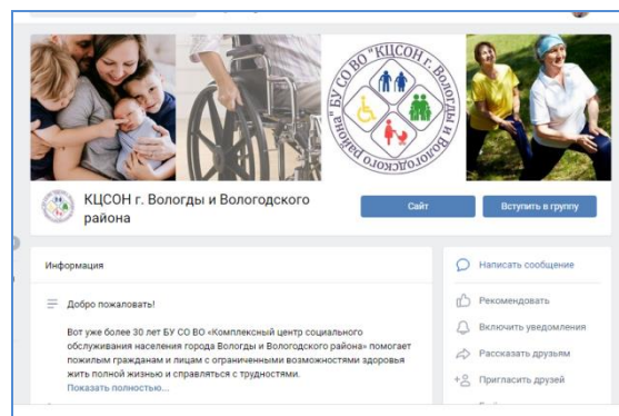
Сайт Комплексного центра